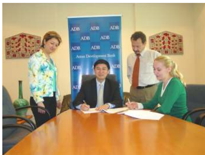
Подписание соглашения между АБР и НИЦ МКВК Центральной Азии