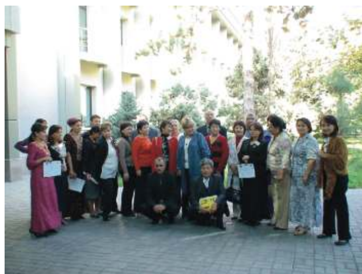
Семинар-тренинг «Основы гендерной теории и методологии гендерного анализа в контексте управления водными ресурсами»